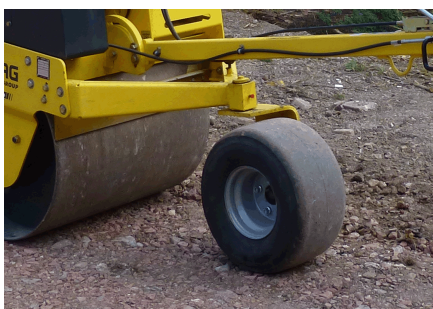
Comando confortevole Kit ruote (opzione)