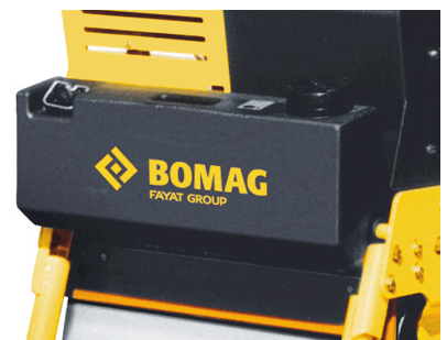
Non aderisce sull'asfalto Spruzzatura d'acqua con grande serbatoio dell'acqua (standard)