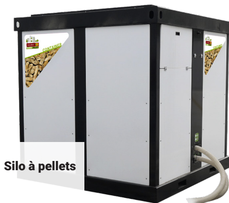
Silo à pellets