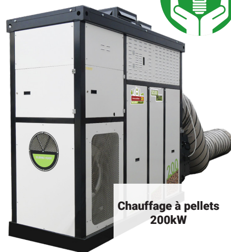
Chauffage à pellets 200kW

Unique et développé spécialement pour vous par Avesco Rent !